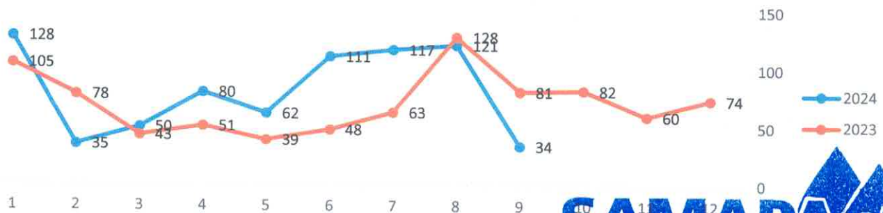
FUGAS DE AGUA REPORTE MENSUAL 2024

AUNADO A UN SALUDO APROVECHO LA OCASIÓN PARA DAR RESPUESTA SOBRE LA INFORMACION “CONTROL ESTADISTICO MENSUAL DE FUGAS, DRENAJES, PIPAS SOLICITADOS EN EL AÑO 2024.”